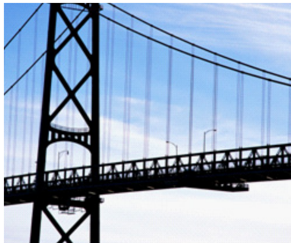
REV arbetar för högre statlig medfinansiering till föreningar som förvaltar broar.